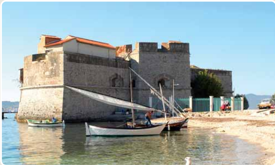
© Cercle de la BdD, Fort Saint-Louis, Toulon