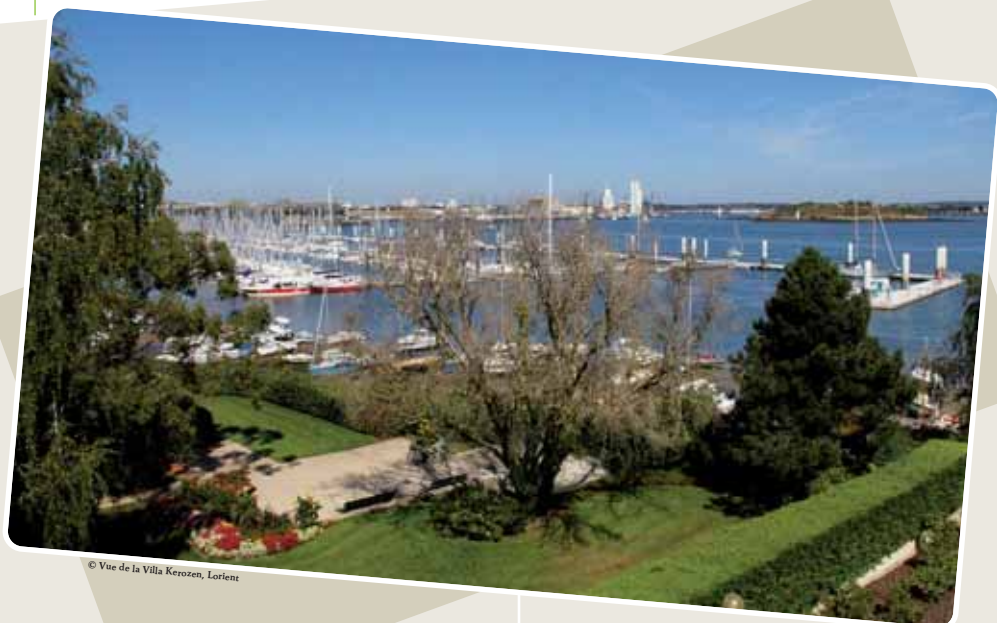
© Vue de la Villa Kerozen, Lorient